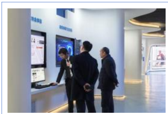
教育部政策法规司原司长