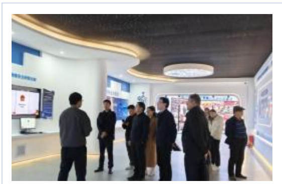
教育厅领导莅临指导