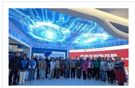
云南财经职业学院退休教师