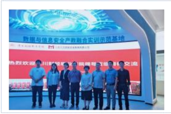
四川财经职业学院