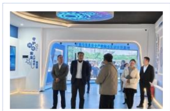
华为技术有限公司